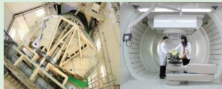
Proton ke ruang perawatan berputar, roda ferris – sistem rak berputar.

TERAPI proton untuk memberikan efek pengobatan yang lebih dan terapi yang lebih baik, peralatan terapi proton perlu dilengkapi dengan arah multi-sudut pengobatan.