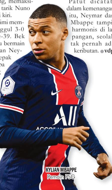
KYLIAN MBAPPE Pemain PSG

Patut dicatat, dalam kemenangan itu, Neymar dan Mbappe tampil harmonis di lapangan, seolah tak pernah ada keributan. vdp