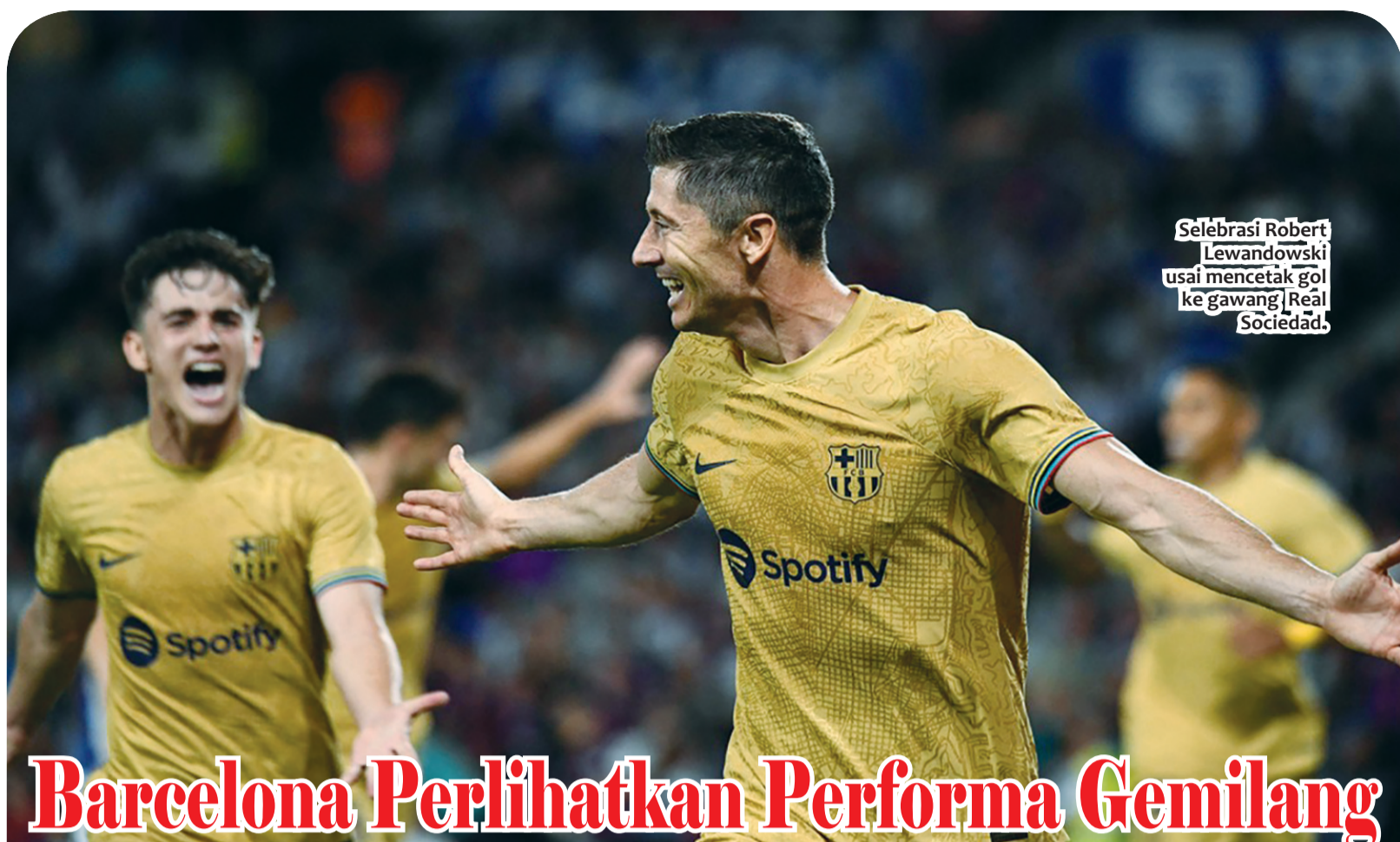
Selebrasi Robert Lewandowski usai mencetak gol ke gawang Real Sociedad.